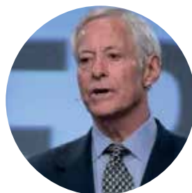
Брайан Трейси Основатель ВТИ, бизнес-тренер